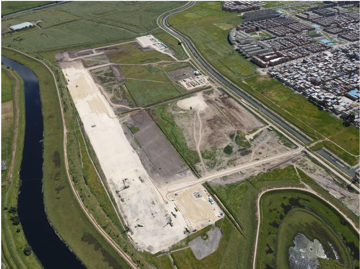
Avance en el proceso de descapote y adecuación de terreno.

Bogotá, 18 de febrero de 2022. El buen clima de inicio de año ha permitido que los ingenieros y el personal de obra en el patio taller de la Primera Línea del Metro de Bogotá trabaje a doble turno para reportar un avance del 15.87 % en la adecuación de las 35,9 hectáreas de terreno, que duplica el porcentaje programado del 7,38 %. Este 17 de febrero se cumplieron seis meses del inicio de obras.