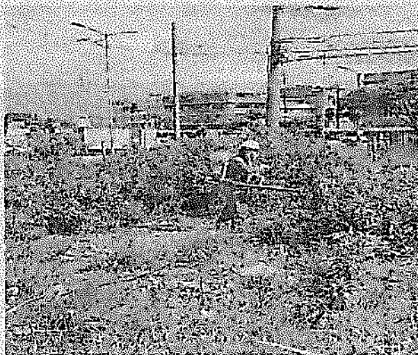
Imagen 1. Fumigación contra roedores e insectos

A continuación, se presenta un registro fotográfico de las actividades de mantenimiento adelantadas en los predios de la KR 30 con Calle 8 Sur