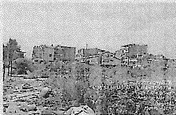
Imagen 2. Personal del Consorcio realizando la separación y recolección de residuos sólidos ordinarios